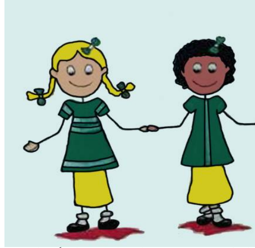
الشكل (4): بنات يرتدين الزي المدرسي الموحد والملابس الطويلة.

6. كانت الملابس التي ترتديها الفتيات في الصور طويلة تتماشى مع الثقافة المحيطة كما في الشكل (4)، على غرار الزي المدرسي وملونة من أجل جذب الطالبات وجعلهن يشعرن بشعور الانتماء.