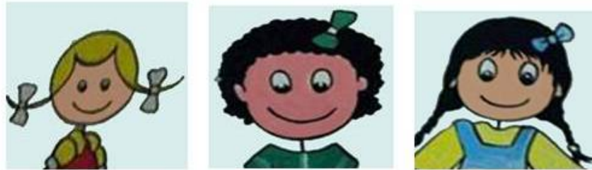
الشكل (2): العيون في الصور المعروضة.

لقد صممت الباحثة الصور بالأخذ بعين الاعتبار العوامل التالية: 1. اختيار الصور بدون كتابة أي نص وذلك للأسباب التالية: بعض الطالبات سوف يتوقفن وبالتالي سوف يُعقبن انسياب حركة المرور للطالبات عن طريق أخذ الوقت من أجل القراءة. إن إضافة أي نص سوف يعطي معنىً معيَّنًا على عكس الصورة التي يمكن أن تحمل عدة دلالات. ولذلك تم استخدام الصور فقط لأن الأبحاث وجدت بأن الأمور المرئية