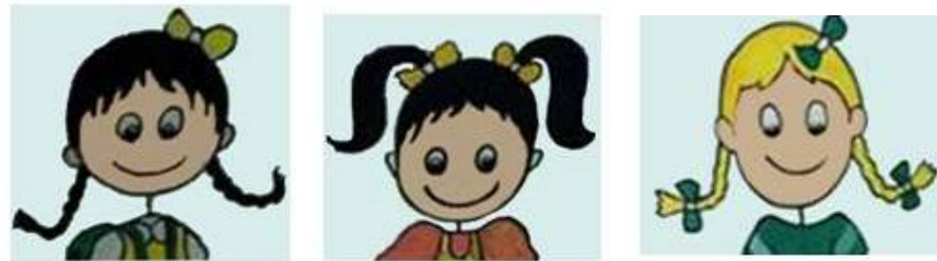
الشكل (3): الوجوه المبتسمة على الصور المعروضة.

4. جميع الوجوه في الصور كانت مبتسمة -كما يظهر في الشكل (3)- لأنه قد أظهرت الأبحاث أن صور الوجوه المبتسمة تطلق مادة الأندورفين والتي تحمل صفات مضادة للاكتئاب وإعطاء شعور طبيعي بالارتياح، وأن الوجوه المبتسمة تساعد الطلاب على الشعور بأنهم موضع ترحيب ومحبوبين؛ حتى تستلطف الطالبات الصور المعروضة حيث