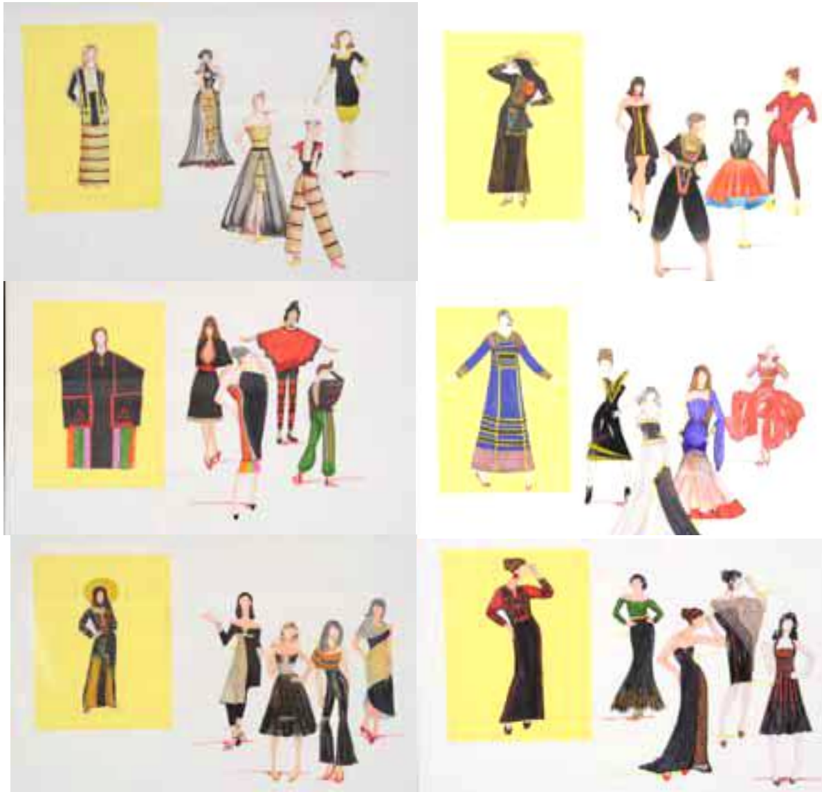
شكل (3). نماذج من رسوم عينة البحث لمجموعة من الأزياء المبتكرة والمعاصرة

يوضح شكل (2) ان اتجاه منحني توزيع افراد العينة تبعاً لتقديرتهن في الاختبار القبلي لم يأخذ التوزيع الطبيعي حيث الغالبية منهن رسب في الاختبار وحصل البقية على مستوى ضعيف وجيد. بينما في الاختبار البعدي قارب اتجاه منحني توزيع افراد العينة تبعاً لتقديرتهن التوزيع الطبيعي حيث تقاربت اعداد من حصلن على