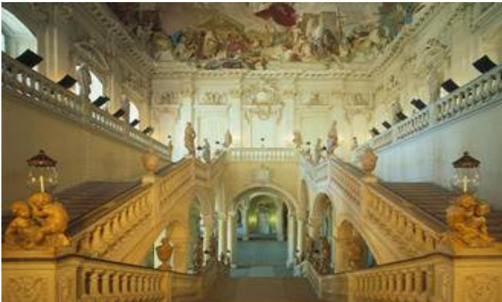
شكل رقم (1) منظور داخلي لعمارة الكوك عصر النهضة لقاعة الدخول والدرج في قصر (Residenz) للمعمار فور تسبوغ (wurzbürger) ألمانيا (25).

إدراكي من فكر المصمم وبصورة مباشرة الى فكر المتلقي الذي يواجه العمل التصميمي وقد يستمر هذا الاتصال لزمان طويل الأمد، وان تأسيس هذا النظام الثقافي مبني على المعلومات والتعلم، فذلك هو مبني على نظام رموز معين (22). وهنا تتعزز الرؤية بان الحياة الاجتماعية تدار بالرموز، ولكل رمز معنى فالصورة الذهنية هي التي تشكل الرموز من خلال المخيلة، والتفاعل الرمزي سبب رئيسي لتفسير والتأويل لتحويل الفرد الى ذات اجتماعية فلا بد من إتقان الرموز بصورة محكمة والتي تحصل منذ نشأتها الاجتماعية. فالإنسان يتمتع بالسعادة والأمان عندما يحس ويدرك ويكتشف معاني الفضاء الداخلي من خلال رموزه. فالرمز الذي يطرح للتداول لا يكون توالياً ما لم يكتسب الصفة الاجتماعية. ويفسر التعاقد الاجتماعي حسب فكرة (يونك) في اللاشعور الجمعي بأن الأوهام والأساطير والذكريات الفطرية لدى كل شخص منقولة اليه بالوراثة البيولوجية عبر الأجيال المتعاقبة منذ اقدم العصور الى اليوم (10). وإن الاستمرارية التاريخية لمعاني المحاكاة الرمزية (التداولية) تعود للشعور الموجود في المواقف الفكرية للفرد في المجتمع. شكل رقم (1) يوضح ملامح تاريخية تحمل صور ذهنية مؤثرة.