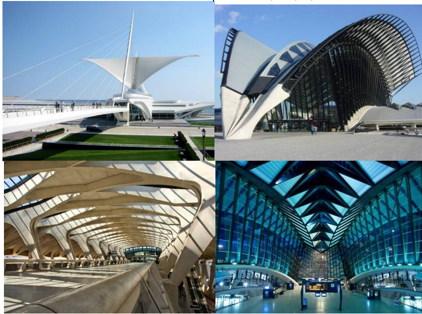
شكل رقم (2) يوضح تجسيد رمزاً لفكرة الطيران والمرور لمشروع TVG (26).

عملية منظمة، هدف المعنى هو أحداث التغيير المرغوب في سلوك الأنسان، المعنى يتغير حسب تطور المجتمع). ونلاحظ المعنى التعبيري في مشروع TGV انظر شكل رقم (2) للمعمار Clatrava أشاره إلى فعالية السفر، وتجنيد ذلك الرمز الذي يمثل صورة لنصب يمكن تمييزه كمبنى لنقل المسافرين مولداً بذلك رمزاً لفكرة الطيران. عرض التصميم وجهة نظر مميزة بكون ان تصميم المبنى إشارة تحمل رسائل أيديولوجية للتعبير عن استعارات متماثلة مع مرجع مستمد من الماضي، لتكوين بنية شكلية رمزية قابلة ان تصبح أيقونة للإدراك المعرفي. والمعنى هو جزء من عملية الإدراك عند الأنسان تدفعه المنظومة الفكرية للاهتمام الى الهدف الذي يقود المتلقي وفق ارتباطات حسية (فكرية، أدائية) لتحقيق الاتصال الجمعي ويجعل المتلقي يدور داخل هذا الشكل وتنظيمه الفضائي المصمم الذي يثير المتلقي بما هو مقصود مما تحفقه الذاكرة وما تعطيه المخيلة والصورة الذهنية له. وفي كل الأحوال فإن المعنى يتحول الى شكل من خلال دلالاته الحسية والإدراكية التي تبحثها خصائصه المظهرية (7). وفهم المعنى هو العملية تبدأ بالإدراك اساساً وفهم الدلالة هي فهم المعنى.