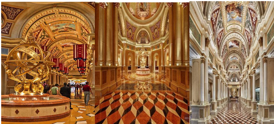
الصور رقم (7)، توضح فضاء صالة الاستقبال لفندق فينيسيان ريسورت هوتل (29).

يقع فندق فينيسيان في مقاطعة لاس فيغاس-أمريكا، اذ تم إنشاء تصميم فضاء صالة الاستقبال بهيئة دائرية الشكل ذات سقف تميز بمناظر معمارية من معالم مدينة البندقية في إيطاليا، انظر الصور رقم (7).