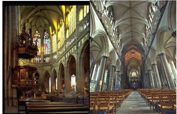
شكل رقم (4) يوضح الحركة التي يوحى بها تسلسل الاعمدة في الكنيسة (25).

لضمان استمرارية حضور وتكرار القيم الحسية التي سبق وان مر بها وحقق من خلالها مستويات معينة من الإرضاء المعنوي (17). وينتج التحفيز الحسي عن البيئة الداخلية التي يدركها الإنسان بالإشارات (المؤثر) وهذه الإشارات إما أن توجه الفرد بشكل مباشر يتم تلقيها بصورة رموز (مرئية او لفظية) او بشكل غير مباشر من قبل أفراد آخرين.