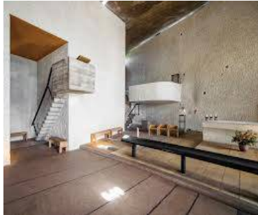
شكل رقم (8)