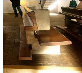
شكل رقم (6)

شكل (1-7-3) الامنموذج الاول (كنيسة رونشامب) (اعداد الباحثة)