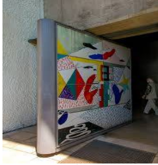
شكل رقم (3)