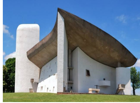
شكل رقم (1)