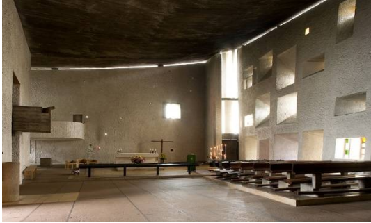
شكل رقم (5)