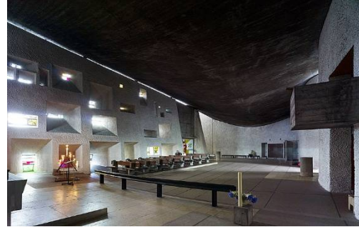
شكل رقم (4)