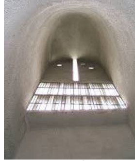
شكل رقم (2)