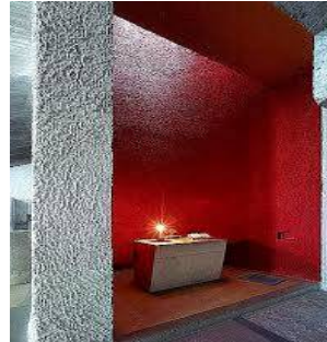
شكل رقم (7)