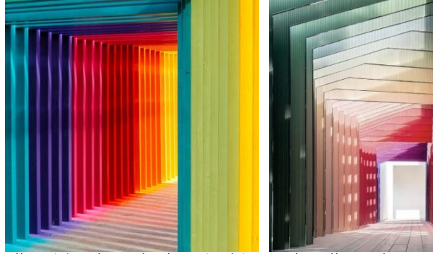
صورة (3) استخدام التدرج اللوني لمجموعة لونية في المعالجات الحائطية في للفراغ الداخلي