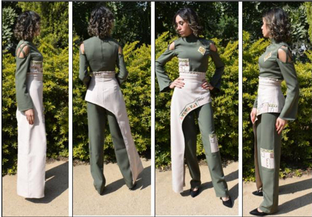
صورة (10) التصميم الثاني المنفذ