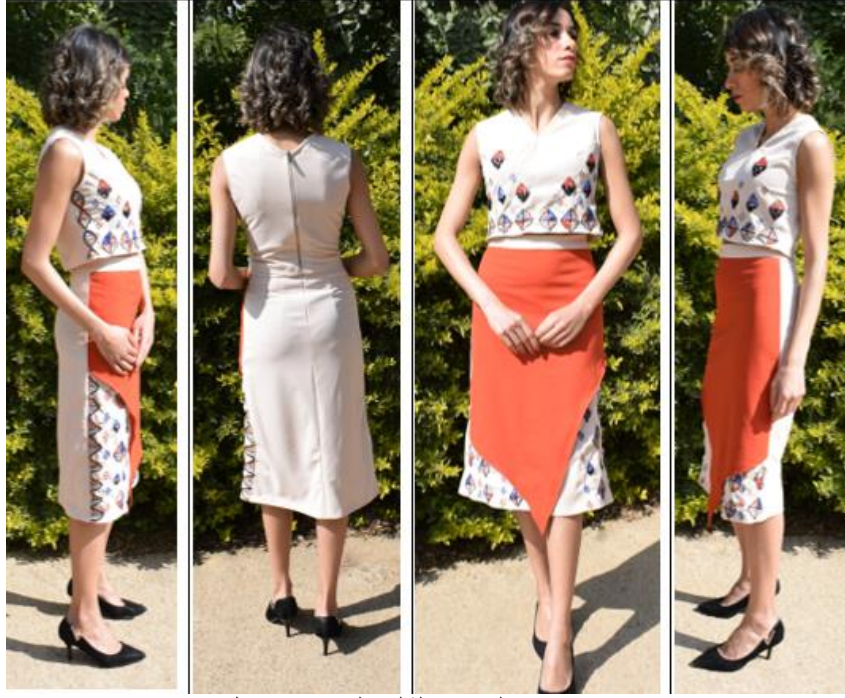
صورة (15) التصميم الثالث المنفذ بدون شال