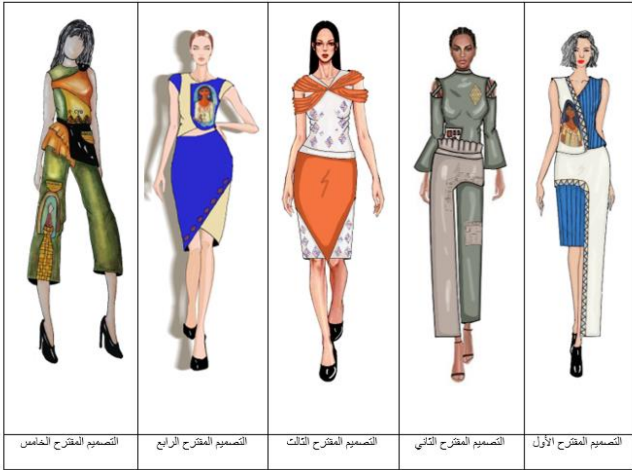
صورة (3) اسكتشات التصميمات المقترحة من التصميم الأول للتصميم الخامس