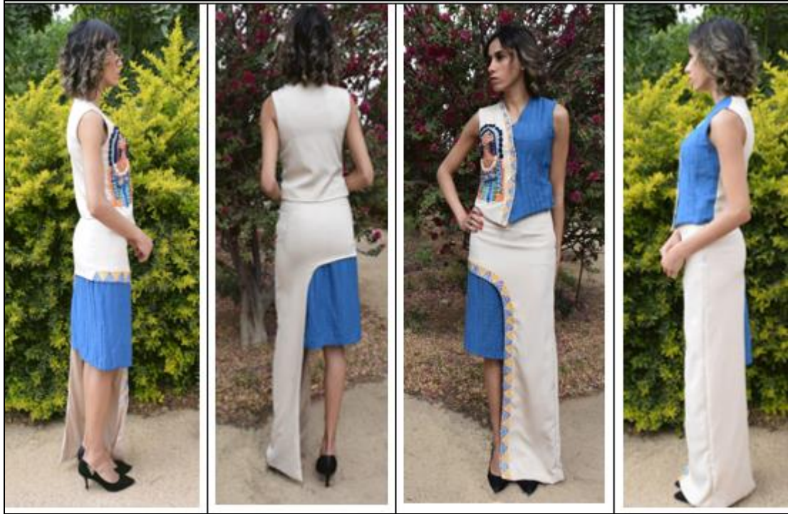
صورة (6) التصميم الأول المنفذ