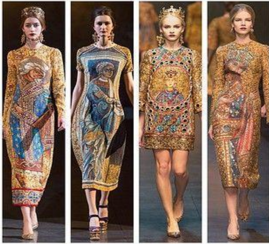
صورة (1) تصميقات بيت أزياء دولتشي وجبانا مستلهمة من الموزايك https://www.vogue.com/fashion-shows/fall-2013-ready-to-wear/dolce-gabbana

Gabbana. فقد قدم عرض أزياء في أسبوع الموضة بميلانو خريف /شتاء 2013/2014 مستوحى من الموزايك، كما هو موضح في الصورة (1). بالإضافة لبيت الأزياء الأمريكي اوسكار دي لارينتينا Oscar de la Renta والذي قدم عرض أزياء