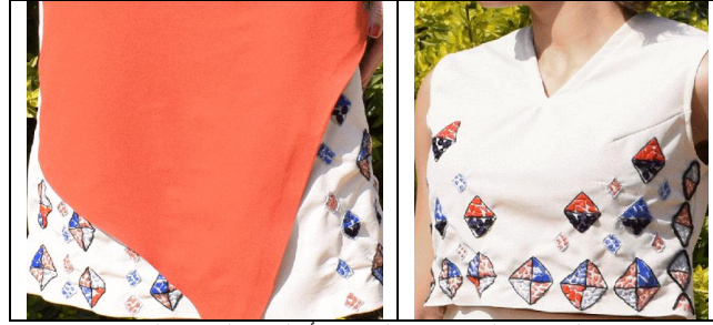
صورة (16) التقنيات المستخدمة لتحقيق أسلوب الموزاييك