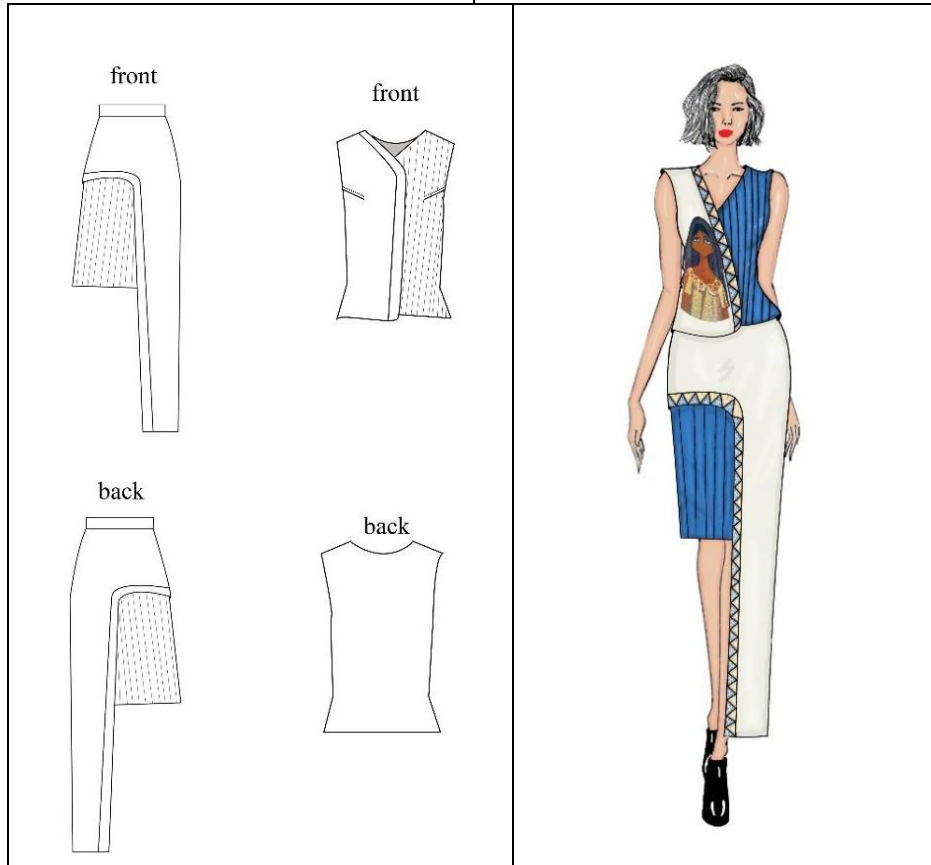
صورة (5) اسكتش التصميم المنفذ الأول - الرسم المسطح