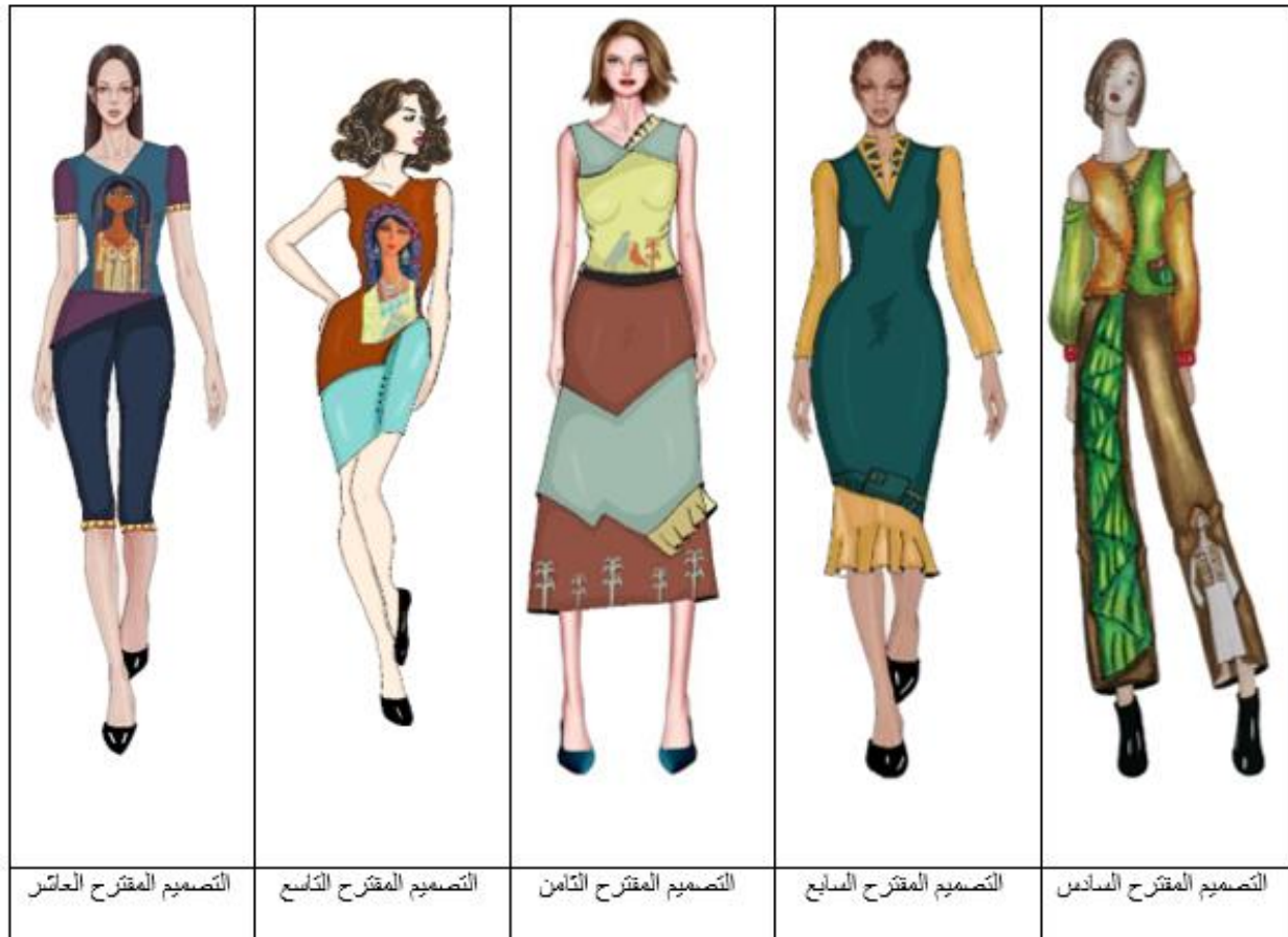
صورة (4) اسكتشات التصميمات المقترحة من التصميم السادس للتصميم العاشر