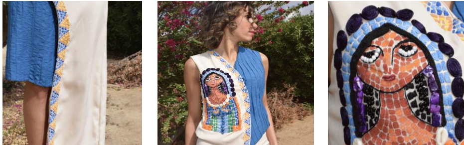
صورة (7) التقنيات المستخدمة لتحقيق أسلوب الموزاييك