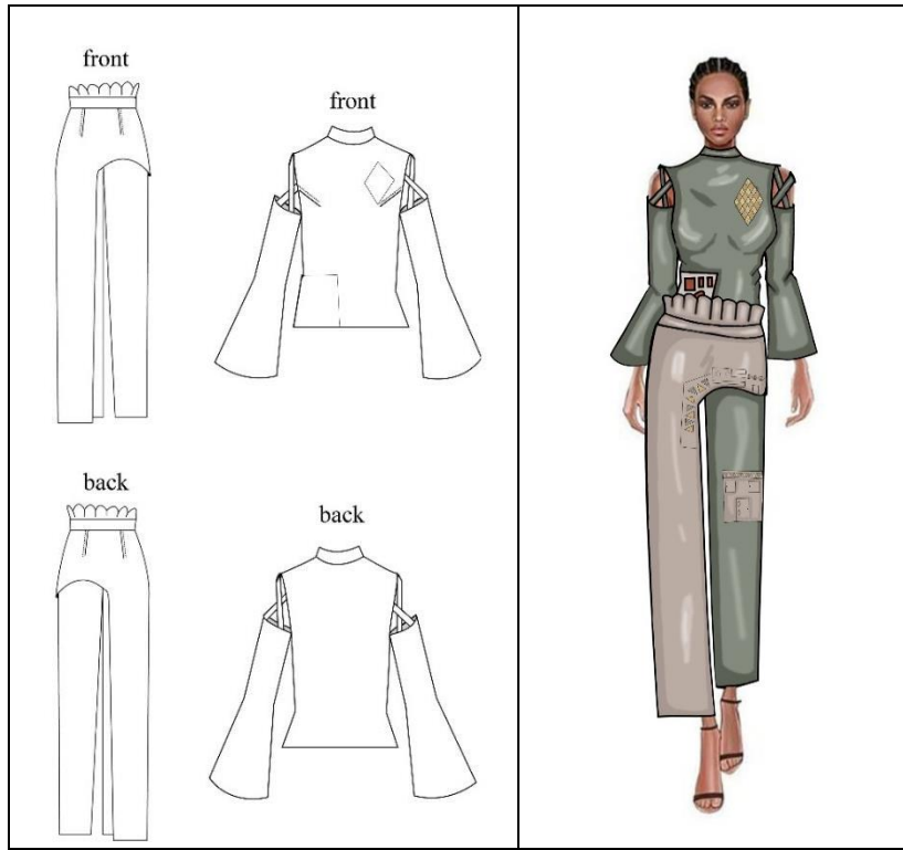
صورة (9) اسكتش التصميم المنفذ الثاني - الرسم المسطح