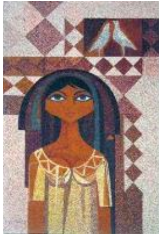
صورة (8) لوحة للفنان وفيق المنذر بفاعلة الاجتماعات (مركز الاهرام الاستراتيجي) بخامة الجرانوليت