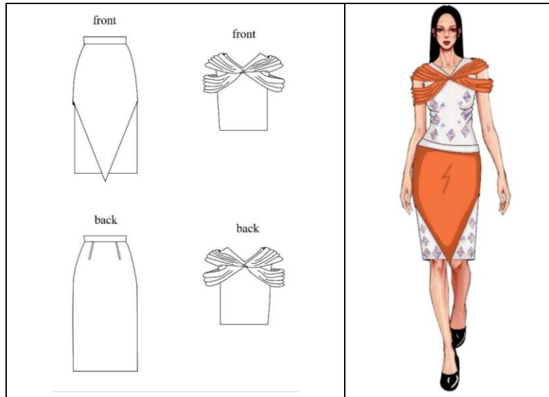
صورة (13) اسكتش التصميم المنفذ الثالث - الرسم المسطح