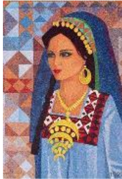
صورة (17) لوحة للفنان وفيق المنذر عام 1999م بخامة الجرانوليت