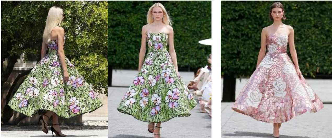
صورة (2) تصميقات بيت أزياء اوسكار دي لارينتينا منقذه بتقنية الموزايك https://www.oscardelarenta.com

مواكب لاتجاهات الموضة العالمية ومستلهمين من لوحات الفنان وفيق المنذر، ثم تم اختيار أفضل 10 تصميقات صورة (3) (4) لعرضهم بالبحث وتحليل توصيفهم من حيث توصيف القطع الملابسية، وتوضيح الخامات الأساسية والمساعدة المقترحة في التنفيذ وتوضيح التقنيات المقترحة استخدامها في تنفيذ زخارف الموزايك في التصميم.