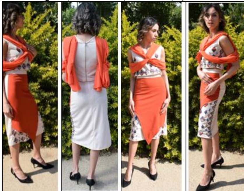
صورة (14) التصميم الثالث المنفذ