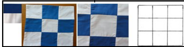
صورة (٤) إعداد التقنية، والمنتج النهائي لتقنية تجاور القماش بمساحات واحدة

ويقصد به تجميع مجموعة من الخامات المنسوجة أو غير منسوجة أو الأثنين معاً، ووضعها على مسطح الأرضية في توازن وتآلف تام ثم تثبت بغرز حياكة ظاهرة أو غير ظاهرة