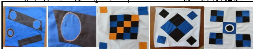
صورة (٥) المنتج النهائي المنفذ لتقنية تجاور الخامات بأسلوب مساحات هندسية بغرز غير ظاهرة "يدوي وبالماكينة" بغرز زخرفية يدوية

- المنتج النهائي كيس خديبية. - الخامات المستخدمة : خامات قطنية. - الألوان : بني، وبرتقالي.