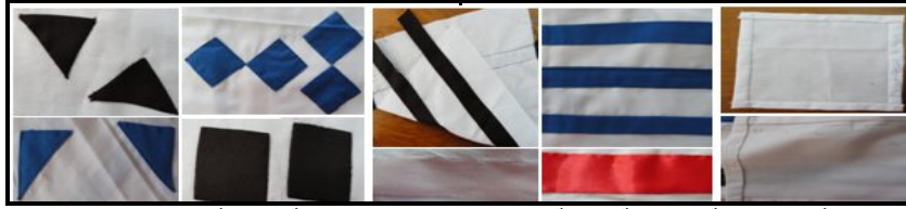
صورة (٣) عينة اللفق العادية والسحرية، وعينة غرز ظاهرة وغير ظاهرة، وعينة زوايا وأركان غرز ظاهرة وغير ظاهرة

في محاولة لملأ فراغ الأرضية كلها وقلما ما يظهر أي جزء منها وينقسم تجاور الخامات بهذا الأسلوب إلى عدة أنواع منها: ١- تجاور الخامات بأسلوب المرفقات بمساحات واحدة One Patch Design Patch Work : نفذت منتجات نهائية بأسلوب المرفقات بمساحات واحدة حيث يعد التكوين الزخرفي كامل بتكرار شكل واحد وليكن مربع كما بالصورة (٤) من أقمشة مختلفة الألوان لتحاك مع بعضها البعض إما يدوياً أو بالماكينة ويعتمد هذا النوع على تغطية الأرضية كلها، بحيث تكون هذه الأقمشة الأرضية، وخطوات تنفيذها كالاتي: