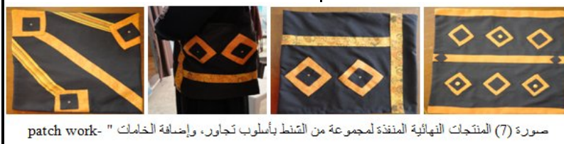
صورة (7) المنتجات النهائية المنفذة لمجموعة من السنتط بأسلوب تجاور، وإضافة الخامات "patch work"

وتوضح الصورة (٨) مجموعة من المنتجات النهائية المنفذة أثناء التدريب بالجمع بين الأسلوبين السابقين "التجاور والإضافة" للخامات مع بعضها البعض وفوق بعضها البعض.