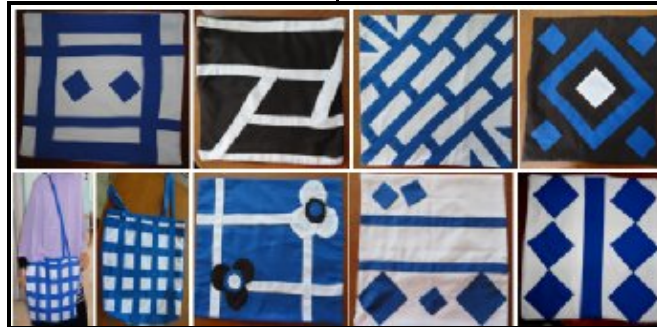
صورة رقم (٨) المنتجات النهائية المنفذة والملائمة للاستخدام بأسلوب تجاور وإضافة الخامات Patchwork

وتوضح الصورة (٨) مجموعة من المنتجات النهائية المنفذة أثناء التدريب بالجمع بين الأسلوبين السابقين "التجاور والإضافة" للخامات مع بعضها البعض وفوق بعضها البعض.