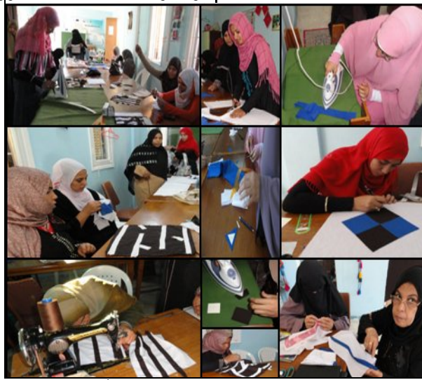
صورة (١) توضح تطبيق البرنامج التدريبى المقترح أثناء جلساته

٣- تطبيق البرنامج : طُبق البرنامج عام فى الفترة من ٢٠١٠/١١/٦ إلى ٢٠١٠/١١/١١ حيث استغرق ستة جلسات بواقع ستة ساعات للجلسة الواحدة، أى أن الوقت الكلى هو ستة وثلاثون ساعة لتطبيق البرنامج وفقاً للمخطط الزمنى للجلسات المحدد مسبقاً. وقامت الدارسة للتأكد من توافر مناخاً تدريبياً مناسباً وذلك من خلال التأكد من تجهيز المكان المخصص للتدريب ومدى ملاءمته لإجراء التجربة من حيث الإضاءة – التهوية – الأدوات اللازمة لإجراء التجربة (منضدة – أدوات القص والحياكاة – أدوات التصميم – الخامات الأساسية والمساعدة – الخيوط). ومن ثم قامت بتقديم نبذة مختصرة عن البرنامج وأهدافه، وطريقة التدريب طوال أيام التدريب للمتدربات. ونفذ البرنامج وفقاً لتخطيط جلساته المعدة مسبقاً، ومحتوى كل جلسة كما بالصورة (١)