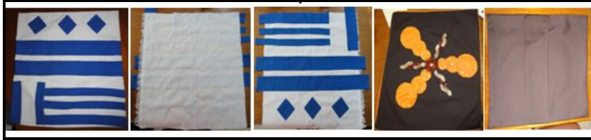
صورة (٦) المنتج النهائي المنفذ لتقنية تجاور الخامات "patch work" بأسلوب إضافة الخامات