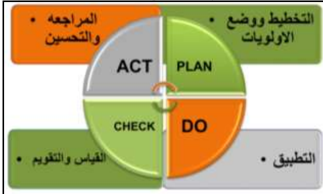
شكل (1) عجلة ديمينج للتحسين المستمر