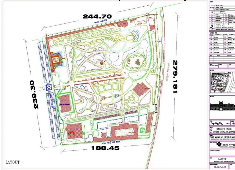
رسم توضيحي (3) يوضح المسقط العام لقصر الأمير محمد علي بالمنيل

يلاحظ عند دراسة المساقط الأفقية لمصممي العمارة الإسلامية