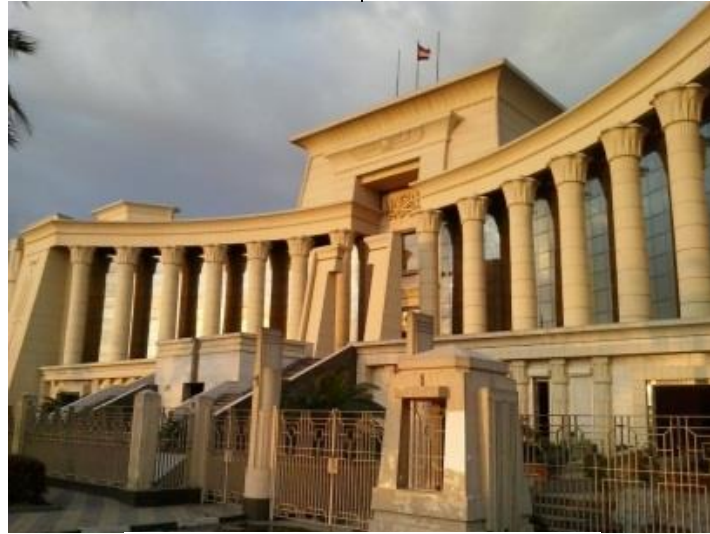
شكل (٩) يوضح البناء المعماري للمحكمة الدستورية

الفراغ البيضاوى بحكم تكوينه الهندسى يجعل المحور الطويل أهم من المحور القصير الا أن تطابق المحورين مع محور الكنيسة يساعد فى التمهيد للمبنى دون الإحساس بالخوف أو الرهبة من