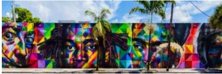
شكل (١١) إدواردو كوبرا Eduardo Kobra - جدارية سلفادور دالى - شارع وينوود Wynwood - ميامى Miami - ولاية فلوريدا - الولايات المتحدة الأمريكية - ٢٠١٣

ومن جانب آخر شهد القرن العشرين طفرات علمية غير مسبوقة أثرت بشكل كبير وواضح على الإنتاج الفنى ومفهومه، وأصبح من الضرورى استثمار التكنولوجيا فى العمل الفنى، وادى تداخل المجال التكنولوجى والفن التشكيلي الى انتاج نوع جديد من الفنون التى جعلت المتلقى أكثر تفاعلا معها، مما جعل المصمم يبحث عن كيفيات جديدة لإبداعه مستعينا بكل ما قدمته الثورة التكنولوجية