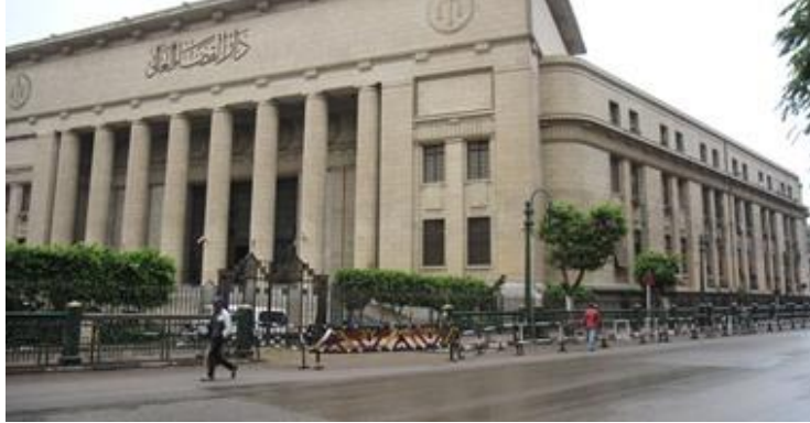
شكل (١٠) دار القضاء العالى -وسط القاهرة

الإعتبار الإحساس المكاني والتجربة الفراغية التى يمر بها المتلقى والمستخدم لهذا المكان حتى يشعر بفخامة وضخامة المبنى للشعور بالعظمة والشموخ والتى هى من أهم سمات الحضارة المصرية القديمة . وهذا عكس ما نراه فى تصميم دار القضاء العالى مثلا، حيث نتقلنا التجربة الفراغية من شوارع ضيقة ومزدحمة الى أن نصل فى