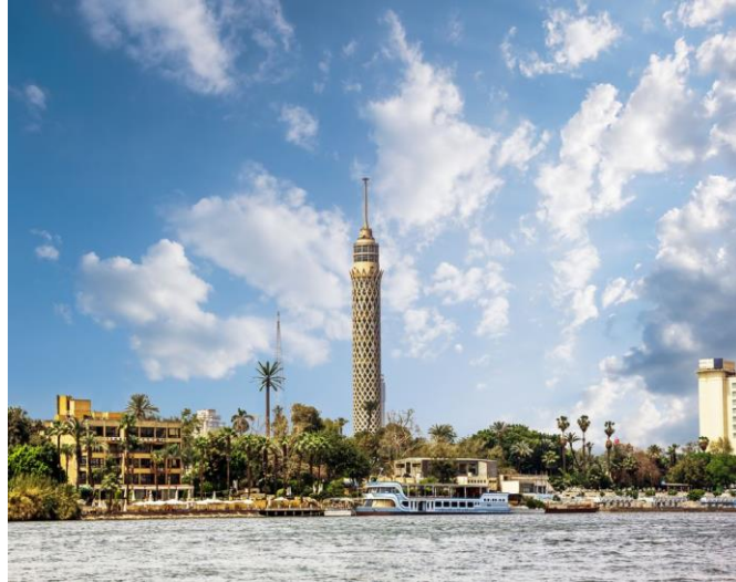
شكل (٥) برج القاهرة - صناعة رمز : تشكيل بسيط يرتبط بمعنى يسهل تلقيه واستيعابه

العناصر الذهنية من جهة التكوين وبالتالي الأقرب لعملية التلقى هي التي تكون على نفس المحور أو على محور عمودي أو مقابلة مكانيا وغيرها من العلاقات التكوينية البسيطة .