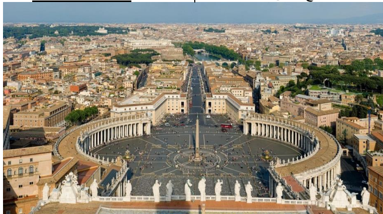
شكل (٧) ساحة كاتدرائية القديس بطرس

http://www.nationsencyclopedia.com/index.html , (11 May 2012)