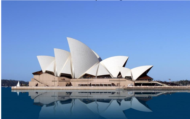
شكل (٦) علاقة مكانية واضحة في أوبرا سيدني - استراليا

ويعنى وجود ارتباط ذهني بين كل من عناصر التصميم، بحيث يمكن الوصول لأي منهم عن طريق باقي العناصر، ولما كان العقل البشري يتجه بطبيعته الى تبسيط المدركات، فإن أنجح