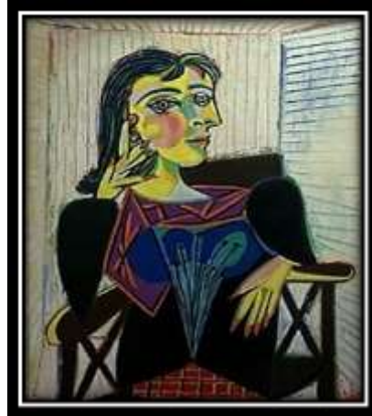
شكل (11): "بورتريه دورا مار" - بيكاسو