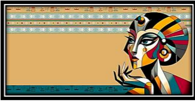
الفكرة التصميمية رقم (10)