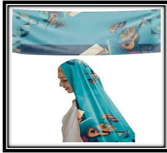
مقترح توظيفي رقم (7)

التحليل الفني: استوحى بناء هذا التصميم من لوحة "عازف القيثارة المُسن" الشكل رقم (7) لبيكاسو واعتمدت على الاستعانة بالطابع المصري القديم المتمثل بالعنصر البشري للتأكيد على الحضارة المصرية القديمة والشبكية الهندسية المنتظمة واستخدمت المساحات والخطوط المستقيمة، الرأسية، والأفقية والمائلة مما أثنى من التنوع الخطي الذي ساعد على الإحساس بالحيوية والاتزان معاً من خلال الربط بين مساحات الأرضية، والأشكال الهندسية المستخدمة في العمل والعناصر والمفردات كل ذلك عمل على خلق حالة تجمع بين التصميم رقم (8):