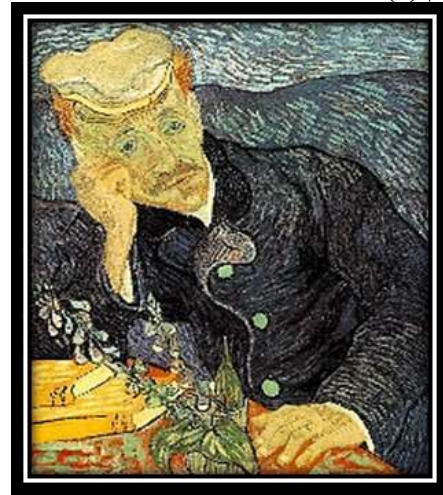
شكل (6): "بورترية دكتور غاشيه" - فنسنت فان جوخ