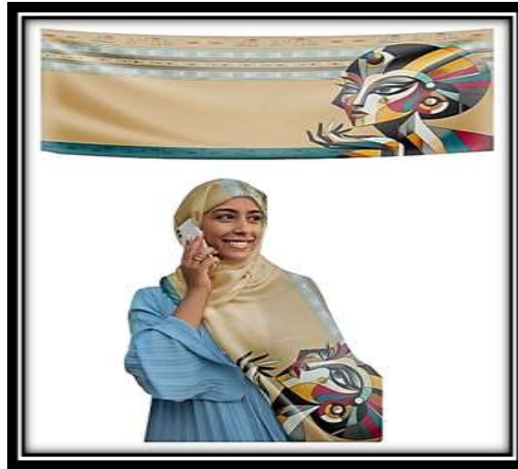
مقترح توظيفي رقم (10)

3- أن استخدام الهوية المصرية في تصميمات البراندات الطباعية يمكن أن يساهم في بناء صورة إيجابية للعلامة التجارية وتعزيز الولاء لدى العملاء المحليين والعالميين.