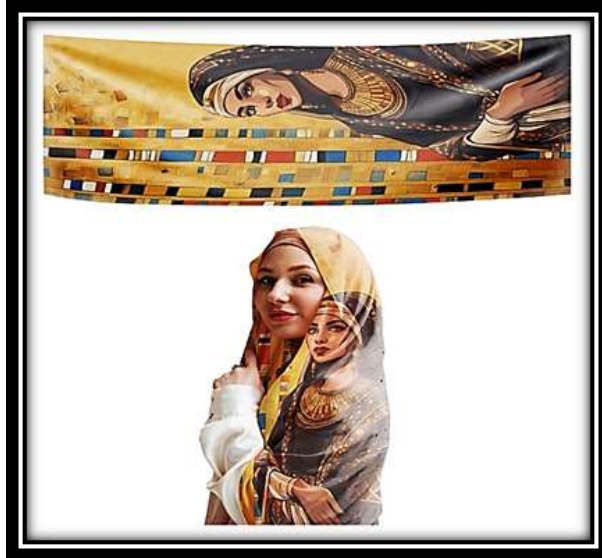
مقترح توظيفي رقم (4)