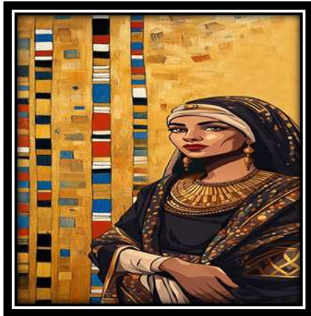
الفكرة التصميمية رقم (4)

التحليل الفني: استوحى هذا التصميم من لوحة "الدة ويسلر" الشكل رقم (3) للفنان جيمس ويسلر واعتمدت فكرة التصميم على إحداث نوع من التناسب والتجاذب بين الأشكال، النسب، والمساحات في صراع أفقي ممتد بعرض التصميم مما أحدث إيقاعاً عن طريق التكرار والترديد بصور منتظمة من خلال تنظيم الفواصل الموجودة والتواصل بينهم لتعطي تنظيماً أقوى تركيبياً بجانب المرأة والعناصر النباتية المختلفة مما أعطي تنوعاً وثباتاً وقوة مطلوبة، وتحقق الإيقاع عن طريق التكرار بألية شبه منتظمة باستخدام التصميم رقم (4):