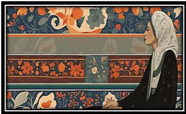
الفكرة التصميمية رقم (3)