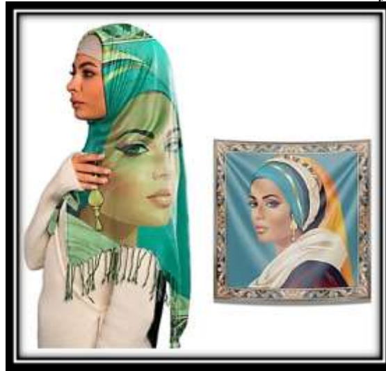
مقترح توظيفي رقم (2)

على الخطوط والزوايا الحادة في التصميم وإعطاء الإحساس بالأبعاد المختلفة للمستويات لإظهار التوازن الذي أعطى إحساساً بالخط وحركته وهذا التنوع أعطى الإحساس بالإيقاع والوحدة والاتزان، وقد تم استخدام مجموعة لونية تتميز بالثراء اللوني فقد جمعت بين الألوان الساخنة والباردة مما اثرى من القيمة اللونية للعمل ككل إلى جانب تأثير الشبكيات الهندسية بالأرضية وتم عمل مقترح توظيفي لوشاح.