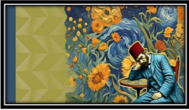
الفكرة التصميمية رقم (6)