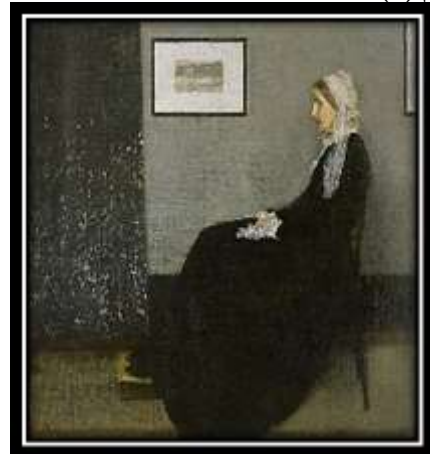
شكل (3): "والدة ويسلر" - جيمس ويسلر