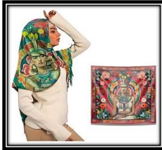
مقترح توظيفي رقم (1)

من خلال التنوع في أشكال العناصر المستخدمة فأحدثت مع الإيحاء بالحياة وهذا التكرار المتساوي بجانب التصميم أحدث انسجاماً وترابطاً وتحقق الإيقاع عن طريق التكرار الذي يمنح الشكل امتداداً بلا حدود، وقد تم استخدام ملمس يشبه النسيج بأرضية العمل لإحداث نوع من الإيقاع بالعمل، وقد تم استخدام مجموعة لونية تتميز بالثراء اللوني فقد جمعت بين الألوان الساخنة والباردة مما أثار من القيمة اللونية للعمل ككل إلى جانب تأثير الشبكيات الهندسية بالأرضية وتم عمل مقترح توظيفي لوشاح.