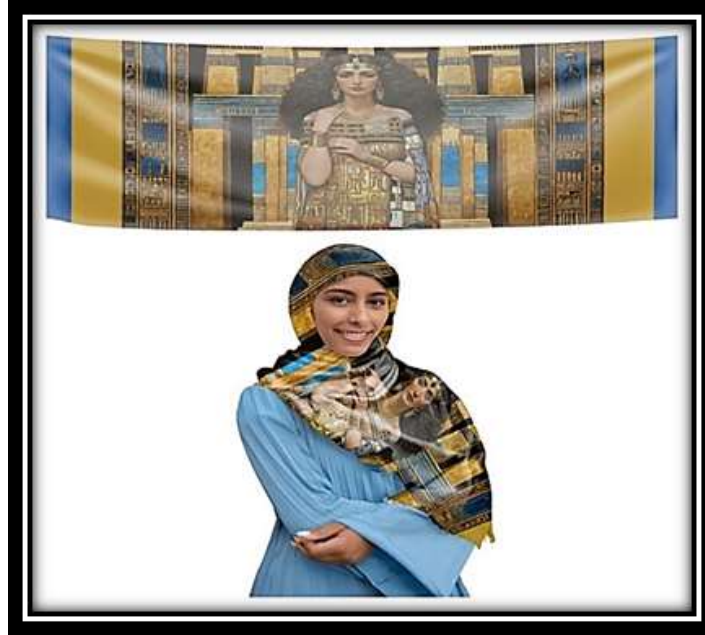
مقترح توظيفي رقم (5)

في العمل والعناصر والمفردات فعمل على خلق حالة من تلاقي الخطوط المتعددة الاتجاهات فأدي إلي تكامل عناصر العمل بعضها مع البعض علي نحو يبلغ من الوثوق أو الإتحاد حداً لا تؤدي معه الظروف الموجودة بينهما إلي فصل وحدة العمل بل تُمرج سوياً من أجل تحقيق الوحدة، وقد تم استخدام مجموعة لونية تتميز بالثراء اللوني فقد جمعت بين الألوان الساخنة والباردة مما أثرى من القيمة اللونية للعمل وتم عمل مقترح توظيفي لوشاح.