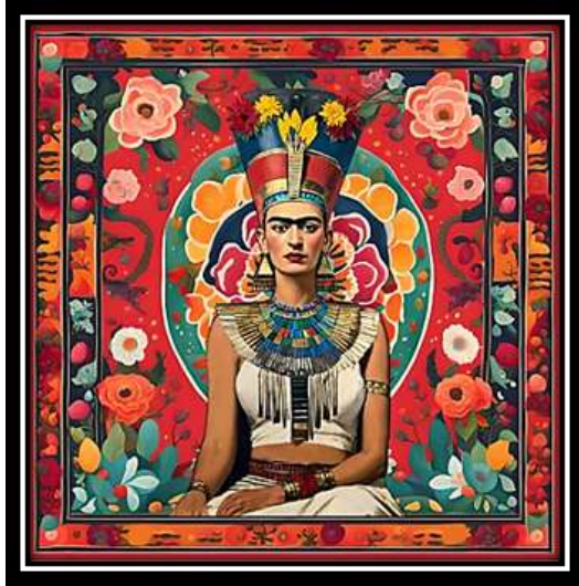
الفكرة التصميمية رقم (1)

- الدراسة التجريبية: مرحلة الأفكار التصميمات الناتجة عن التجربة العملية، مرحلة اختيار التصميم مرحلة النموذج التوظيفي، وفيما يلي عرض للأفكار التصميمية المستوحاة من أعمال بعض الفنانين العالميين لاستحداث تصميمات الأوشحة المطبوعة. التصميم رقم (1):