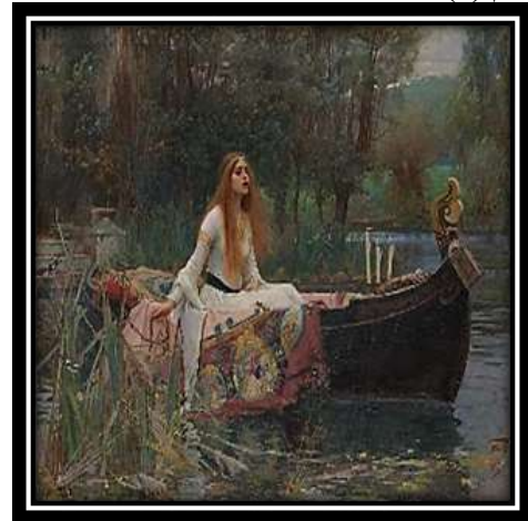
شكل (8): "السيدة شالوت" - جون ولياموترهاوس