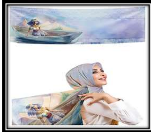
مقترح توظيفي رقم (8)