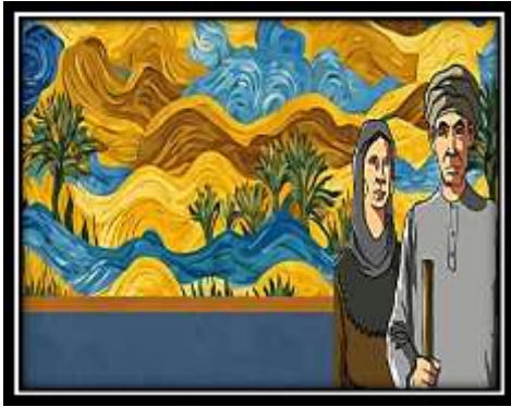
الفكرة التصميمية رقم (9)

التحليل الفني: استوحى بناء هذا التصميم من لوحة "السيدة شالوت" الشكل رقم (8) لجون وليام ووترها واعتمدت على بالعنصر الأدمي في زي مصري قديم للتأكيد على الحضارة المصرية القديمة، والمركب ذات الشراع مما أثنى من التنوع الخطي الذي ساعد على الإحساس بالحوية والاتزان معاً من خلال الربط بين مساحات الأرضية، التصميم بجانب العمل على تباين المساحات المحصورة والناشئة من تلاقي الخطوط المختلفة، والأشكال الهندسية المستخدمة التصميم رقم (9):