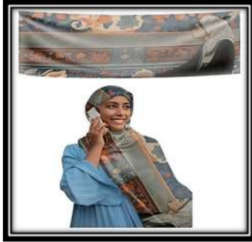
مقترح توظيفي رقم (3)

العناصر الفنية المختلفة مما أثرى من قيمة العمل الفني ككل واستخدام العنصر البشري ايمن التصميم بجانب الاعتماد علي أسلوب التجاور بين العناصر بعضها ببعض وذلك للربط بين الشكل والأرضية، وانعكس ذلك التنوع في الأشكال والعلاقات التصميمية من خلال ذلك التباين الذي تم التأكيد عليه، واستخدمت مجموعة لونية تتميز بالثراء اللوني جمعت بين الألوان الساخنة والباردة مما اثرى من القيمة اللونية للعمل ككل إلى جانب تأثير الشبكيات الهندسية بالأرضية وتم عمل مقترح توظيفي لوشاح.