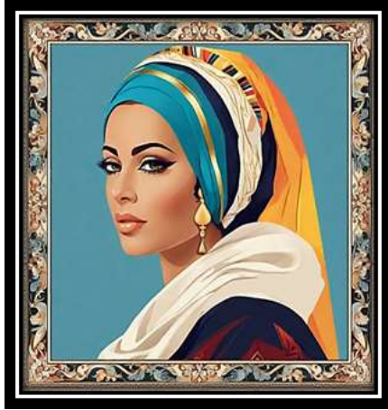
الفكرة التصميمية رقم (2)