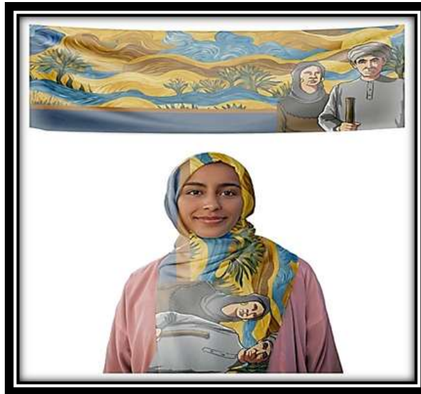
مقترح توظيفي رقم (9)

مما خلق صلة مستمرة وعمل على حسن الجوار بين كل جزء بالتصميم إلى جانب تكراره وانتشاره في التصميم ككل وإعطاء الإحساس بالأبعاد المختلفة للمستويات والإحساس بالعمق وإظهار التوازن الذي اعطى حساً مرهفاً بموسيقية الخط وحركته وهذا التنوع أعطي الإحساس بالإيقاع والوحدة والاتزان، وقد تم استخدام مجموعة لونية تتميز بالثراء اللوني فقد جمعت بين الألوان الساخنة والباردة مما اثنى من القيمة اللونية للعمل وتم عمل مقترح توظيفي لوشاح.