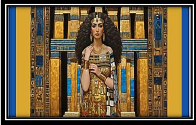
الفكرة التصميمية رقم (5)

التحليل الفني: استوحى هذا التصميم من لوحة "الموناليزا" الشكل رقم (4) لليوناردو دافنشي واعتمد على ظهور امرأة ذو ملامح مصرية اصيلة للتأكيد على الهوية المصرية إلى جانب عناصر التصميم الهندسية والتجاذب بين النسب والمساحات في العمل موزعاً عليها الأشكال والعناصر في اتجاه رأسي فخلق إحساساً بالثبات وهذا التنوع بين الأشكال الهندسية والمرأة أحدث إيقاعاً في التشكيل بالتكرار والترديد بصور منتظمة وتنظيم الفواصل بين المساحات والعناصر والتجاور بين العناصر بعضها ببعض والتنوع التصميم رقم (5):