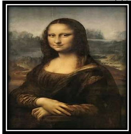
شكل (4): "الموناليزا" - ليوناردو دافنشي