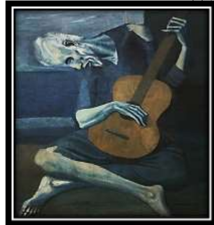
شكل (7): "عازف القيثارة المُسن" - بيكاسو