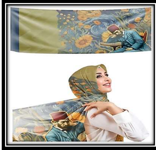
مقترح توظيفي رقم (6)

التصميم مما خلق صلة مستمرة، وظهر ما يُسمى بحسن الجوار بين كل جزء أثناء تكراره وانتشاره في التصميم ككل مع التأكيد على الخطوط والزوايا في التصميم وإعطاء الإحساس بالأبعاد المختلفة للمستويات الذي اعطى حساً مرفهاً بموسيقية الخط وحركته وهذا التنوع أعطي الإحساس بالإيقاع والوحدة والاتزان وقد تم استخدام مجموعة لونية تتميز بالثراء اللوني فقد جمعت بين الألوان الساخنة والباردة مما اثرى من القيمة اللونية للعمل وتم عمل مقترح توظيفي لوشاح.