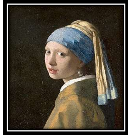
شكل (2): "الفتاة ذات القرط اللؤلؤي" - يوهانس فيرمير