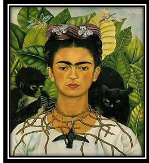
شكل (1): "فريدا كاهلو الذاتية" - فريدا كاهلو