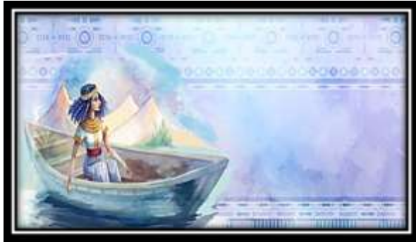
الفكرة التصميمية رقم (8)

الإستاتيكية والديناميكية في العمل ويتحقق الوحدة في التصميم عندما توفر عاملان أساسيان الأول التنظيم الجيد في علاقة أجزاء التصميم بعضها ببعض، والثاني علاقة كل جزء منها بالتكوين الكلي وهذا ما تحقق في هذا العمل مع مراعاة إضافة الخطوط والأشكال الهندسية لملئ الفراغات وأحدث نوعاً الإيقاع المتعاقب المتزن والمستمر، وقد تم استخدام مجموعة لونية تتميز بالثراء اللوني فقد جمعت بين الألوان الساخنة والباردة مما أثنى من القيمة اللونية للعمل وتم عمل مقترح توظيفي لوشاح.