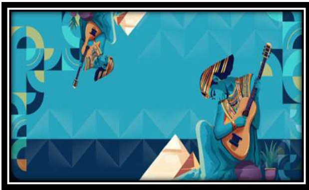
الفكرة التصميمية رقم (7)

التحليل الفني: استوحى بناء هذا التصميم من لوحة "بورترية دكتور غاشيه" الشكل رقم (6) للفنان فان جوخ واعتمدت فكرة التصميم على مزج الرجل ذو الطربوش والأشكال الهندسية مع الخطوط المنحنية لينسقا معاً في مظهر جمالي متعادل مما نتج عنه تناغم وتباين في العلاقة الشكلية الكلية للتصميم والتباين بين الخطوط الهندسية والخطوط اللينة بانسيابية تمتد على جانبي التصميم لقطع الرتابة والملل في التصميم والعمل على تباين المساحات المحصورة والناشئة من تلاقي الخطوط المختلفة فنتج عن ذلك تألف بين أجزاء التصميم رقم (7):