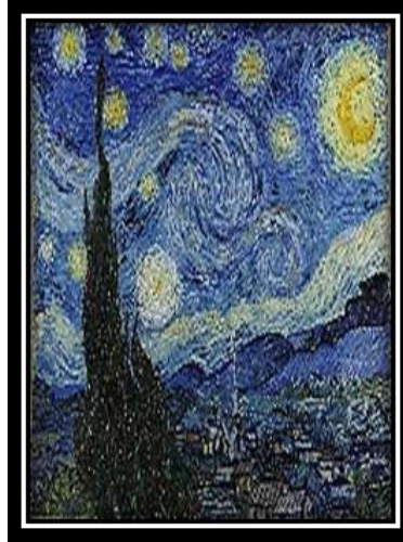
شكل (10) "ليلة النجوم" - فان جوخ