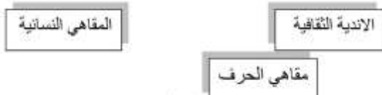
شكل 2 يبين انواع المقاهي (الباحث)

على مدى تاريخ المقاهي المحلية تعددت المقاهي بتنوع النشاطات التي يقوم فيها والمخطط التالي يوضح انواعها: